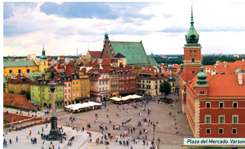
Plaza del Mercado. Varsovia